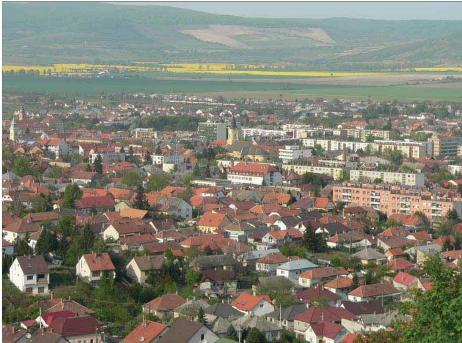
2. ábra. A város látképe a Boglyoskáról 2007 áprilisában – Tringli István Fig. 2 View of the town from the Boglyoskáról, April 2007 – Tringli István