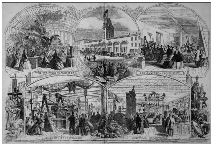
3. kép. A New York-i Amerikai Intézet 36. éves vására, 1865