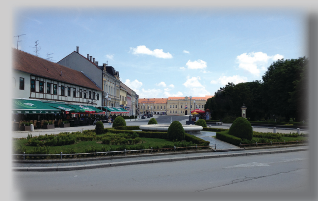
Koprivnica (Kroatien), 2. bis 5. Juli 2013