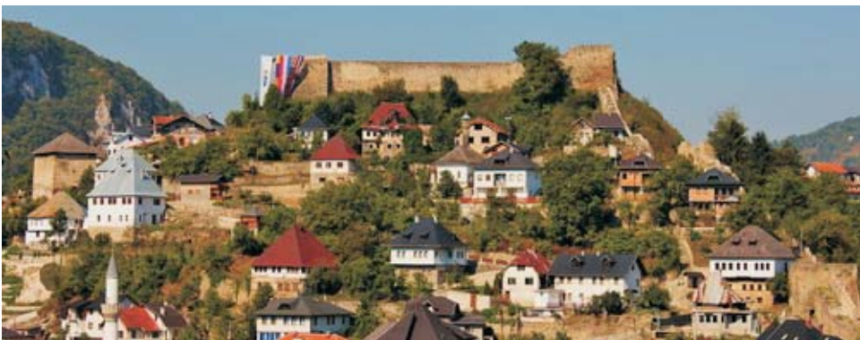
Jajca vára és óvárosa