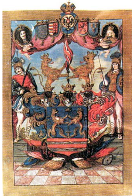
A Keglevicsék címere