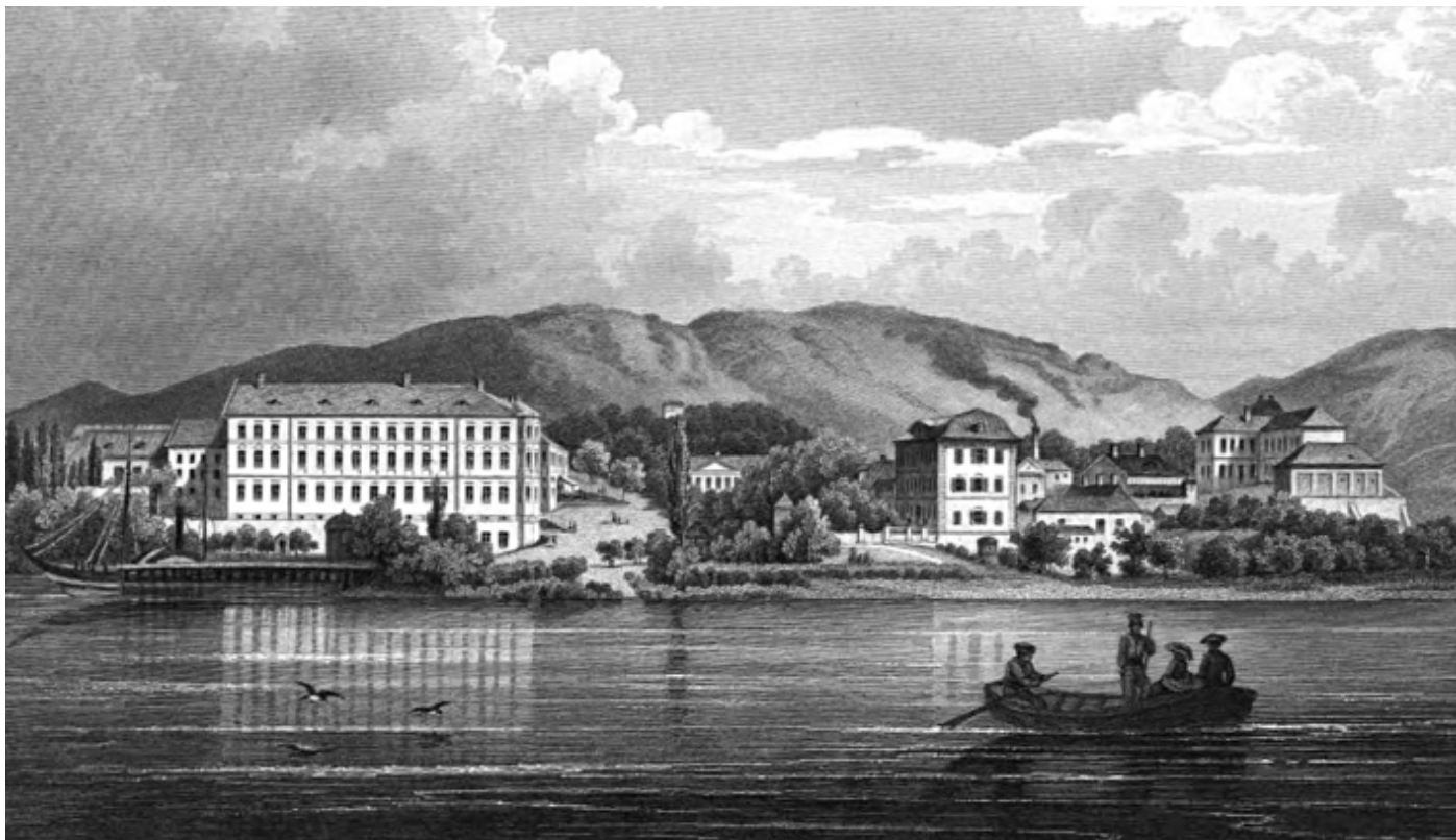
Balatonfüred az 1800-as években