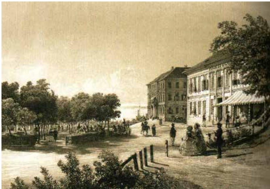
Balatonfüred, a Nagyszálló és a Horváth ház

– Siófok egyebek mellett annak köszönheti gyarapodását, hogy a vasút 1863-as kiépítésével az utasok eleinte akár napokat is vártak, hogy átkelhessenek Füredre. A település azonban felismerte,