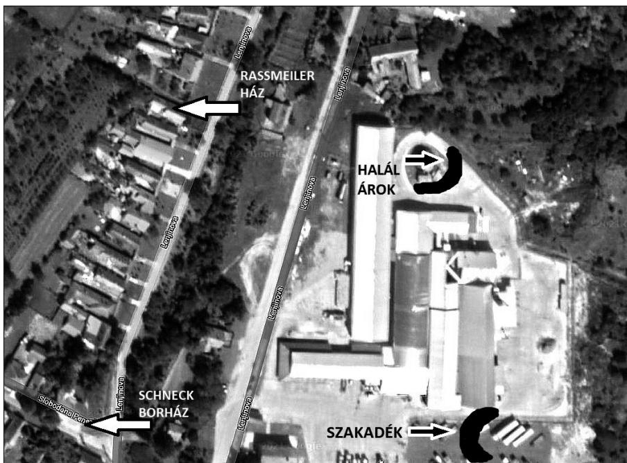
2. helyszínrajz. A szakadék feltételezett helye a cservenkai téglagyárban.

Forrás: A google maps alapján a szerző által készített helyszínrajz. https://www.google.com/maps/place/Cservenka,+Szerbia/@45.6605428,19.4727592,310m/data=!3m1!1e3!4m5!3m4!1s0x-475ca9b83a9d4eef:0x69b5bf754f443289!8m2!3d45.6584711!4d19.4560093. / .